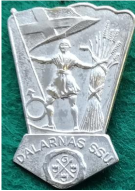
5.12 Dalarnas SSU . (S.R.244)