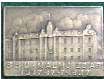
4.4 SSU Malmö 20 år 1917 17/7 1937. (S.R.89)