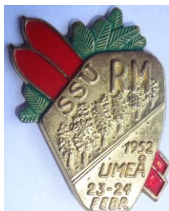
7.4 SSU - RM Umeå 23-24 februari 1952. (S.R.224)