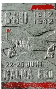
4.5 1917-1942 22 -25 juli Malma Hed, SSU-förbundet organiserade för första gången ett riksläger, hölls i Malmköping i Sörmland och SSU:s 25 årsdag firades. (S.R.91)