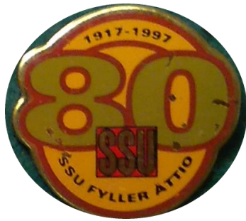
7.14 SSU 80, 1917 - 1997 SSU fyller åttio . (S.R.383)