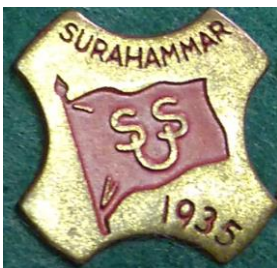
5.3 SSU Surahammar 1935. (S.R.246)