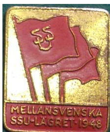
5.8 SSU Mellansvenska SSU-lägret 1948. (S.R.249)