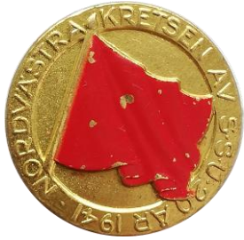
4.2 SSU Nordvästra kretsen av SSU 20 år 1941. (S.R.89)