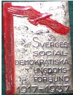
4.3 Sveriges socialdemokratiska ungdomsförbund 1917-1937. (S.R.91)