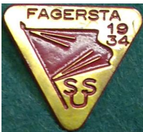
5.2 SSU Fagersta 1934. (S.R.246)