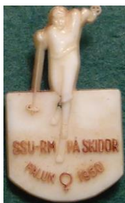
7.3 SSU RM på skidor Falun 1950. (S.R.224)