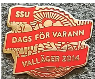
5.11 SSU valläger 2014 dags för varann , den 2–6 augusti fylldes Bommersvik med över 1 000 SSU:are, peppade för valseger.