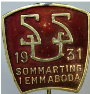
5.1 SSU Sommartinget i Emmaboda 1931. (S.R.249)