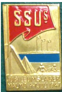
4.9 SSU:s Jubileumsläger Malmö 4-7 juli 1947 , lägret hölls i Malmö med 8 000 SSU:are, en av talarna var Ernst Wigforss. Det första stora internationella ungdomsmötet efter kriget hölls i Köpenhamn två dagar senare. (S.R.91)