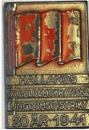
4.15 Hallands Socialdemokratiska Ungdomsdistrikt 20 år 1941. (S.R.684)