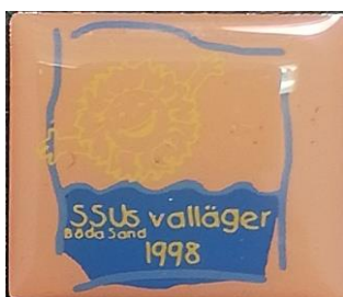
5.10 SSU:s valläger Böda Sand 1998, Öland. (S.R.332)