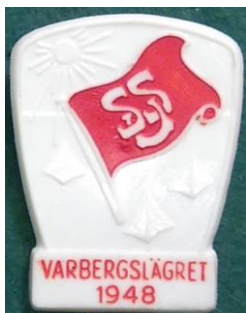
5.7 SSU Varbergslägre t 1948. (S.R.74)