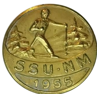
7.5 SSU NM 1955. (S.R.224)