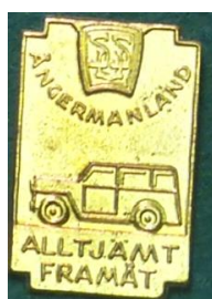
7.6 SSU Ångermanland Alltjämt framåt. (S.R.245)