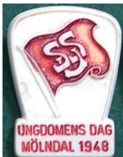
5.6 Ungdomens dag Mölndal 1948 , stort möte med jazz-konsert i Mölndal. (S.R.112)