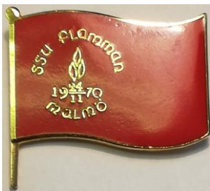
7.15 SSU Flamman 24/11 1970 Malmö , utkom 1986. (S.R.68)