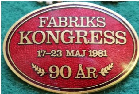
4.1 Fabriks kongress 17-23 maj 1981 90 år. (S.R.38)