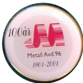
8.4 Metall avd. 96 100 år 1901-2001, Karlskrona. (S.R.491)