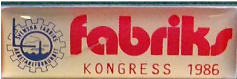
4.2 Svenska fabriksarbetareförbundets kongress 1986. (S.R.53)