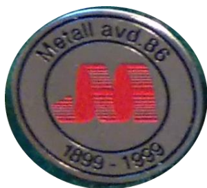
8.3 Metall avd. 86 1899-1999, Borås. (S.R.401)