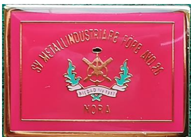
6.9 Sv. metallindustriarbetare förbundet avd. 26 Nora, bildad 1917, märket är en avbild på avdelningens första fana som invigdes 1935. Fanan användes första året vid alla tre Första majmötena som hölls: Socialdemokraternas, Kommunisternas och andra socialisters. Utkom 2002 i samband med en jubileumsaktivitet och användes även som färdbevis med ångtåget mellan Nora och Örebro under jubiléet. (S.R.475)