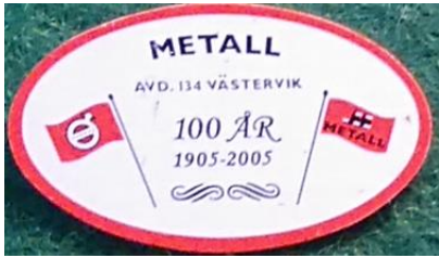
8.7 Metall avd. 134 Västervik 100 år 1905-2005.