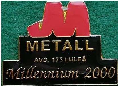
8.8 Metall avd. 173 Luleå millennium-2000, medlemmarna som deltog i nyårsfesten vid millenniumskiftet år 2000, fick märket som ett minne. (S.R.491)