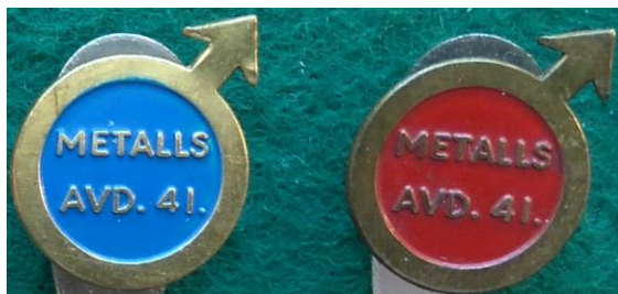
7.3–4 Metalls avd. 41 , Göteborg. Kontingentmärken användes på 1940-talet, blå för halvbetalande medlem och röd för helbetalande medlem. (S.R.63)