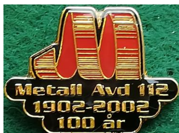
8.5 Metall avd. 112 1902-2002 100 år, Trollhättan. (S.R.491)