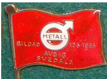
6.8 Metall avd. 16 Svedala bildad 12/5 1895, utkom 1981. (S.R.5)