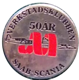
9.8 M Saab-Scania verkstadsklubben 50 år, Linköping utkom 1990. (S.R.351)