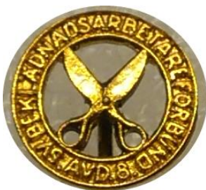
2.6 Svenska Beklädnadsarbetareförbundet avd. 8 i Göteborg . (S.R.268)