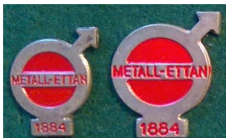
6.1-2 Metall - ettan 1884, utkom 1984. (S.R.30)