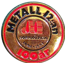
6.7 Metall 12:an Norrköping 1896-1996 100 år.