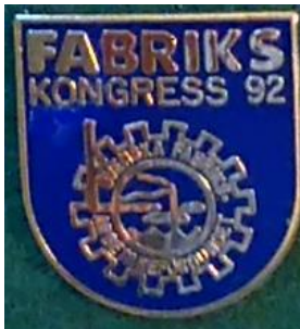
4.3 Fabriks kongress 1992. (S.R.187)