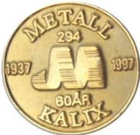
8.9 Metall avd. 294 Kalix 60 år 1937-1997. (S.R.363)