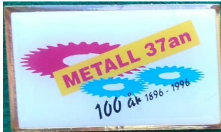
7.1 Metall 37:an 100 år 1896–1996 , Motala. (S.R.363)