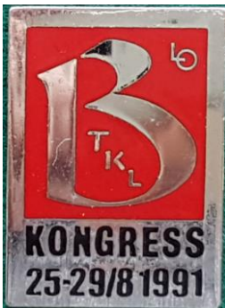
2.4 BTKL LO kongress 25 - 29/8 1991 , Beklädnadsarbetarnas förbund Textil Konfektion Läders förbundskongress 1993. (S.R.268)