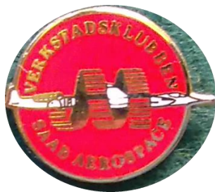
9.9 M verkstadsklubben SAAB Aerospace, Metall avd. 83 i Linköping utkom på 1990-talet. (S.R.491)