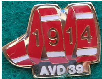
7.2 M avd. 39 1914 , Oxelösund. (S.R.54)