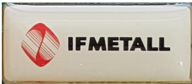
1.1b Nedre raden. IF Metall , utkom 2006. (S.R.618)