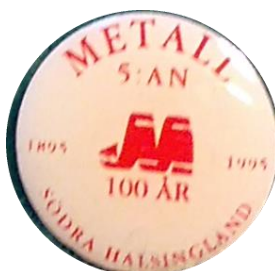
6.5 Metall 5:an 100 år 1895-1995, Södra Hälsingland. (S.R.363)