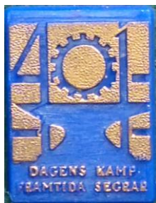
7.5 Metall avd. 41 i Göteborg Dagens kamp framtida segrar , utkom 1956. (S.R.63)